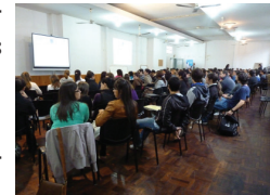
Alumnos en clase, Centro Universitario de Tacuarembó