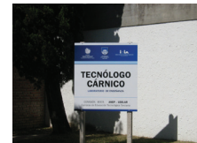
Laboratorios de la carrera Tecnólogo Cárnico predio INIA-Tacuarembó.