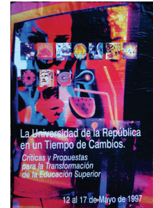
“La Universidad le sirve a usted” Escuela de Bellas Artes