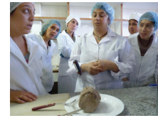
Alumnos de la Carrera Técnico en Operador de Alimentos

Progresivamente la constitución del futuro CENUR Noreste comienza a tornarse cada vez más tangible. Así, en 2009 se inaugura la carrera de Tecnólogo en Madera en Rivera en cooperación con ANEP. Por su parte, para la vida universitaria de Tacuarembó