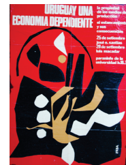
“La Universidad le sirve a usted” Escuela de Bellas Artes

La etapa de la dictadura implica entre otras cosas un quiebre de la actividad universitaria a nivel regional. Así, los reclamos por la presencia de la Universidad desa