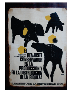
“La Universidad le sirve a usted” Escuela de Bellas Artes