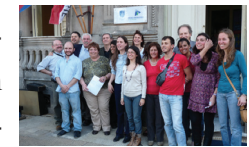
Acto de celebración. De Casa de Tacuarembó a Centro Universitario