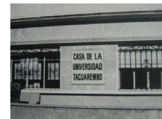
Antigua sede de la Casa de la Universidad de Tacuarembó

Con el firme impulso del Director de la División Servicios del Interior y contando con el apoyo organizativo de la AUT, el 17 y 18 de agosto de 1985 se celebra en Tacuarembó un evento sumamente significativo, el Encuentro con el Interior. La con-