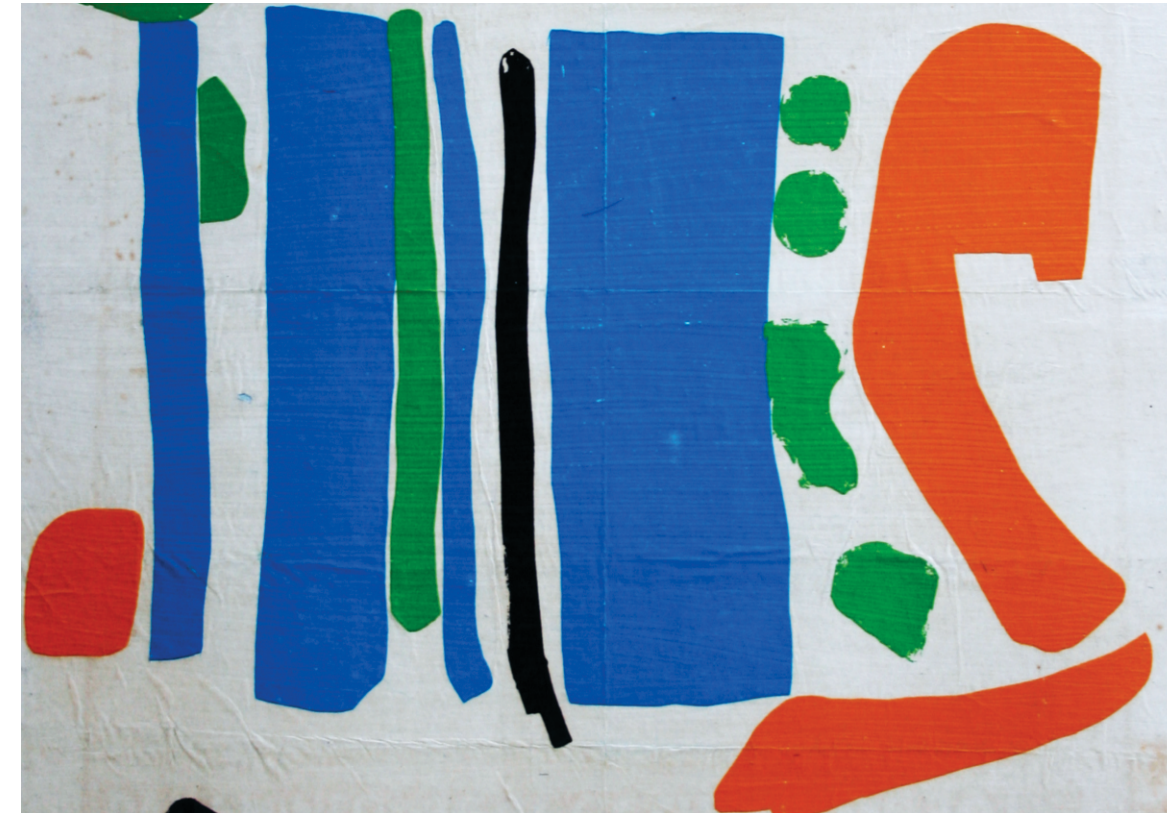
Instituto Escuela Nacional de Bellas Artes-Udelar

Presencia universitaria en el Interior: 25 años de la creación de la Casa de la Universidad de Tacuarembó