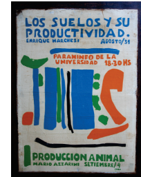
“La Universidad le sirve a usted” Escuela de Bellas Artes

La participación de los egresados universitarios en la Agrupación es un claro indicador de la dimensión del compromiso asumido en aquella época, que para algunos observadores