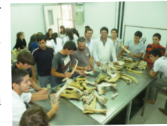
Alumnos de la Carrera de Tecnólogo Carníco

Un año después, el 8 de abril de 2008 el CDC aprueba una nueva ordenanza de Casa y Centros de la Universidad en la que se hace efectiva la dependencia de la Casa de la Universidad de Tacuarembó y de los Centros Universitarios de la CCI. En ese año ese organismo CCI presenta el “Documento de orientación sobre el desarrollo de la Universidad de la República en el Interior” (UdelaR, 2010a). A eso se suma la Res. N° 5 del 25 de noviembre del CDC (UdelaR 2010b), que da pautas programáticas para el desarrollo de la Universidad en el Interior, estableciendo ejes temáticos prioritarios para cada región así como ejes transversales. Para la región Noreste, que abarca los departamentos de Rivera y Tacuarembó, así como en sentido amplio Cerro Largo y Artigas, se definen como ejes prioritarios específicos i) recursos naturales y desarrollo sustentable; ii) temas relacionados con la frontera; iii) madera; iv) carne. Como ejes transversales a todas las regiones se establecen i) arte y cultura; ii) salud; iii) informática, así como iv) formación de docentes de Enseñanza Media. Por otra parte, en la Resolución citada también se aprueba la constitución de Polos de Desarrollo Universitario (PDU) que respaldarán a los PRETs. Dicha resolución encomienda además al Centro Universitario de Rivera y a la Casa de la Universidad de