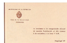
Invitación oficial para la inauguración de la Casa de la Universidad de Tacuarembó