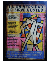
“La Universidad le sirve a usted” Escuela de Bellas Artes