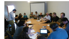
Comisión Intersede -Cenur Noreste

Concretamente, una de las funciones centrales del nuevo docente consistía en la generación de vínculos de la Universidad con la sociedad de Tacuarembó y de representación, lo que implicaba ser la cara visible de la institución en el departamento, con el peso que eso implicaba. Específicamente en el caso de Tacuarembó existía una demanda histórica respecto a la presencia de la Universidad, que a nivel local hasta ese momento era visualizada sólo a través de los cursos. Así, se dio la necesidad de definir modos propios de asumir las funciones, ya que no existían lineamientos taxativos. Por otra parte, los límites presupuestales eran reales, ya que